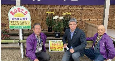
武生菊人形展にて愛好者の方々と