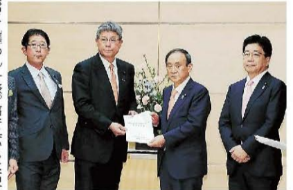
菅首相に要望書を手渡す自民党の高木毅氏－12日午後、首相官邸

記録的な大雪に見舞われた福井県など北陸3県と新潟県の自民党国会議員が12日、菅義偉首相に対し、除排雪などへの財政支援を緊急要望した。菅首相は「しっかりと責任持ってやらせていただく」と答えた。菅首相はじめ、自民党の二階俊博幹事長、小此木八郎防災担当相らと相次ぎ面