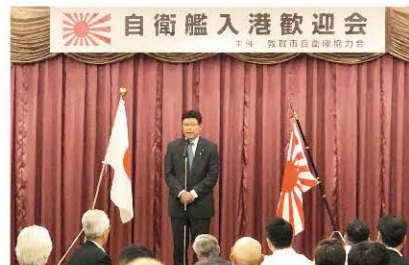
自衛艦敦賀港入港