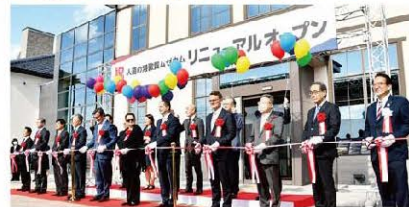
人道の港敦賀ムゼウムリニューアルオープン