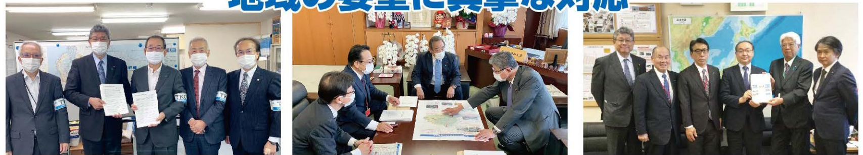
税理士会の方々からの要望を受け、財務省主税局長等へ申し入れ