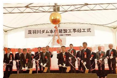
足羽川ダム起工式