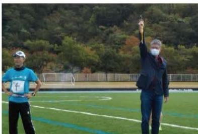
陸上競技のスターターを勤める