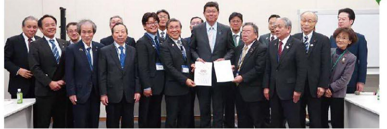
首長や市町村議会の皆様からは様々な要望が寄せられます。要望に応えるべく積極的に取り組んでいます。