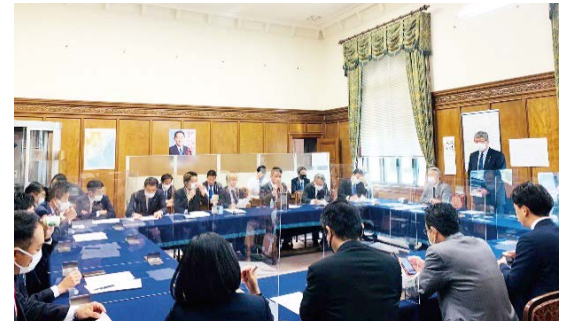
国会対策正副委員長打合せ